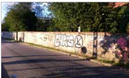
Tak było kiedyś..