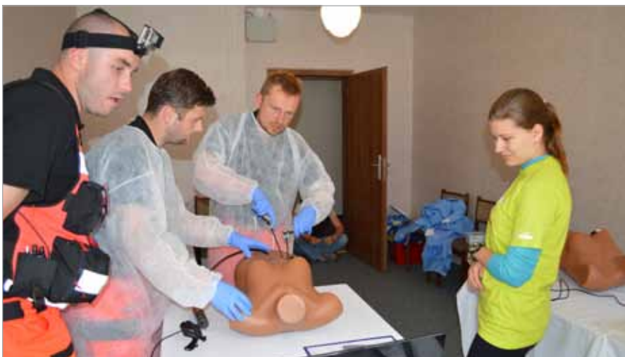
Nasi ratownicy podczas zawodów w Czechach