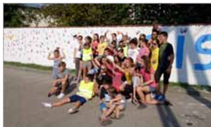
Tak jest dziś!