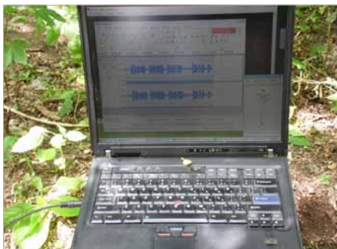
Zapisywana na komputerze transmisja z Radiostacji Varberg – widoczne impulsy układające się w kreski i kropki (pierwsze trzy grupy impulsów to VVV)