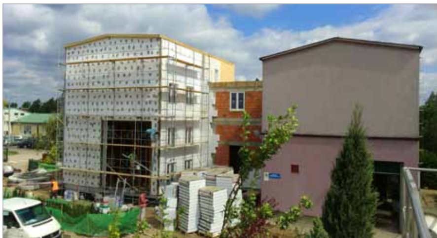
Budynek wielofunkcyjny części mechanicznego oczyszczania ścieków

Aktualny harmonogram prac jest zamieszczony na naszej stronie internetowej, w zakładce JRP- Harmonogram, a w podzakładkach znajdują się dokładniejsze informacje na temat każdego z zadań już realizowanych.