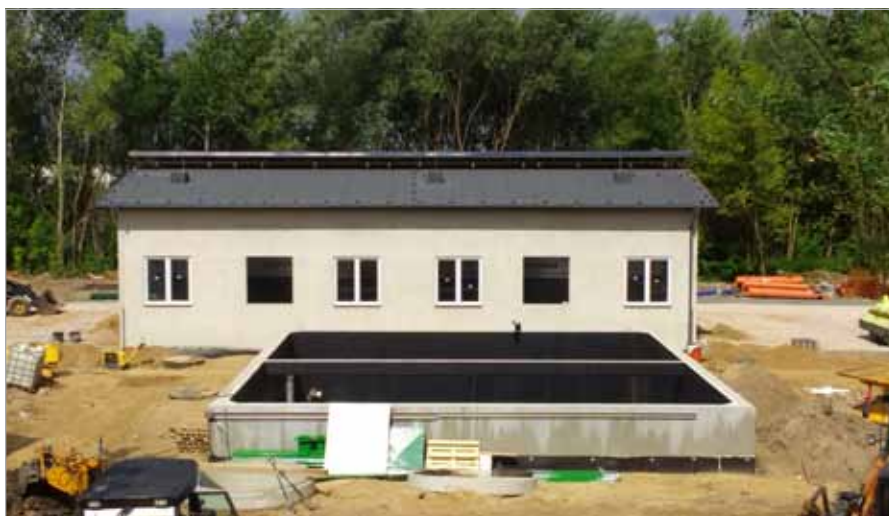
Budynek stacji zlewczej wraz ze zbiornikiem ścieków dowożonych

Wykonawcą tego zadania jest ta sama firma, która wykonała sieć w ulicy Krzyżanowskiego w Klaudynie. Tak samo jak w przypadku tamtego zadania nie ustrzegła się dużych opóźnień w realizacji i błędów w organizacji i koordynacji prac. Przewidujemy, że pomimo tego będziemy w stanie zaprosić mieszkań-