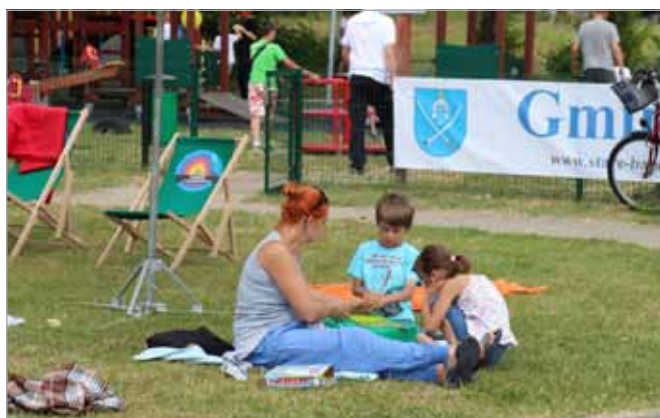
Nie ma to jak poleniuchować...