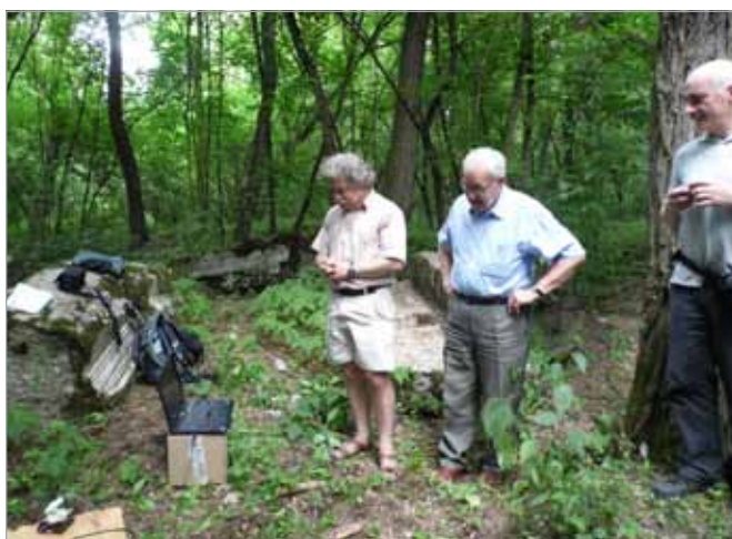
Odsłuchiwanie wiadomości w budynku nadajnika

VVV VVVVVV CQ CQCQ DE SAQ SAQSAQ = THIS IS GRIMETON RADIO/SAQ IN A TRANSMISSION USING THE ALEXANDERSON 200 KW ALTERNATOR ON 17.2 KHZ = 90 YEARS AGO, ON JULY 2ND, GRIMETON RADIO STATION/ SAQ WAS INAUGURATED BY HIS MAJESTY GUSTAF V, KING OF SWEDEN. NOWADAYS THE SITE IS OPEN FOR EVERYONE AND BELONGS TO ALL PEOPLE OF THE WORLD = SIGNED : WORLD HERITAGE GRIMETON AND THE ALEXANDER- GRIMETON VETERANRADIO VAENNER ASSOCIATION + = FOR QSL INFO PLEASE READ OUR WEBSITE: WWW.ALEXANDER.N.SE = INFO = WE ARE SORRY BUT THE TRANSMISSION AT 09.00 UTC DID NOT WORK BECAUSE OF A SHORT CIRCUIT IN THE ANTENNA AND NO TRANSMISSION WAS POSSIBLE = DE SAQ SAQSAQ