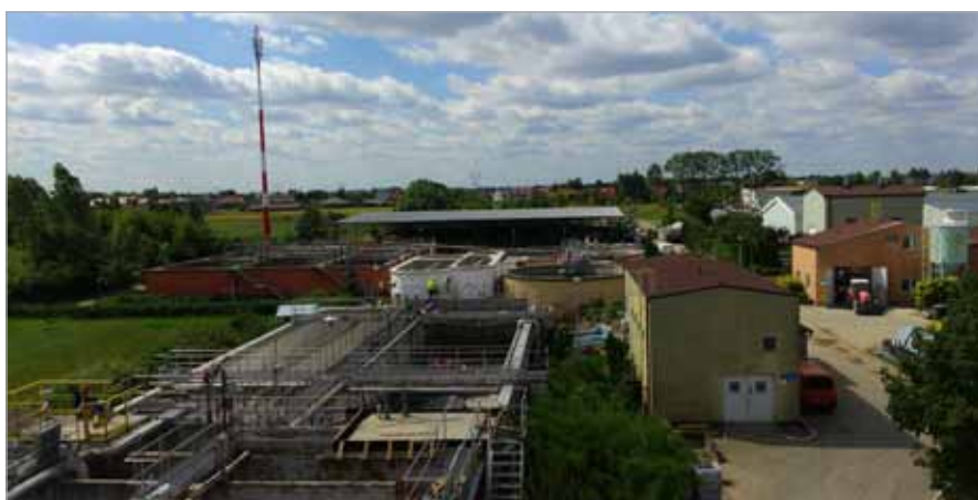
Reaktor biologiczny wraz z nowobudowanym zbiornikiem defosfatacji i denitryfikacji