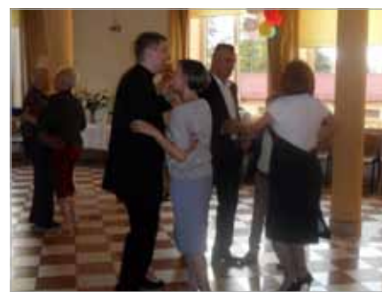
Bal w Domu Parafialnym „Arka”

Kiedy pogoda zaczęła się psuć i poczuliśmy krople delikatnego deszczu, przenieśliśmy się do sali w Domu Parafialnym „Arka”. W środku również czekał na rozpoczęcie poczęstunek. Około godz. 19 rozpoczął się bal. Zagrała zaprzyjaźniona z nami orkiestra. Repertuar był dostosowany do wszystkich gości, niezależnie od wieku. Uczestnicy rozchodzili się do domów najedzeni, zadowoleni i zmęczeni popołudniem pełnym atrakcji.