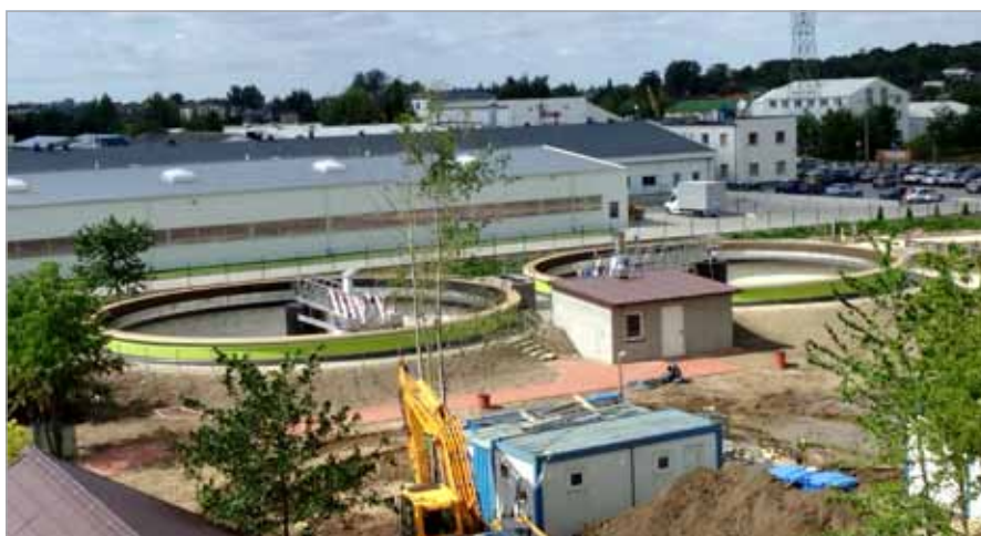
Osadniki Wtórne Radialne

O dalszym postępie prac i ewentualnych problemach realizacyjnych będziemy Państwa informowali w kolejnych artykułach zamieszczonych na łamach „Gazety Babickiej” i na naszej stronie internetowej.