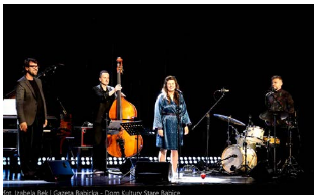
fol. Izabela Bek | Gazeta Babicka - Dom Kultury Stare Babice